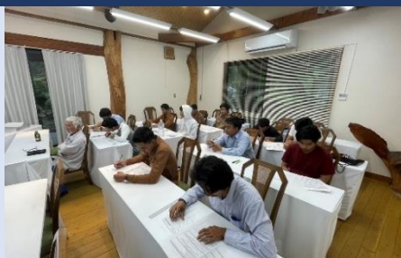
小型移動式クレーン運転