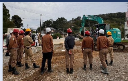
車両系建設機械(整地等)