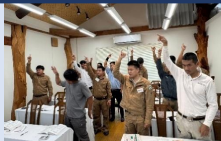
車両系建設機械(整地等)