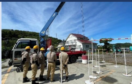
フォークリフト運転