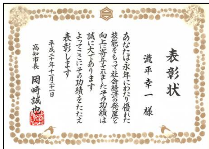
平成20年度 市長表彰 受賞