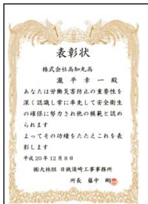
(株)大林組 現場所長表彰 受賞

フランスから日本に最初に導入したバイプロフォンサーで成功し、又日々の技術研鑽が認められ、(株)大林組 社長表彰、現場所長表彰、高知市長表彰、土木学会技術功労賞を受賞する。