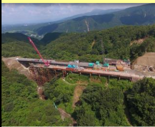
熊本県 俵山大橋復旧工事