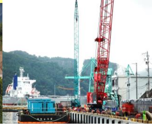
岩手県 釜石漁港復旧工事