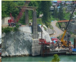
福島県 本名ダム下流工事