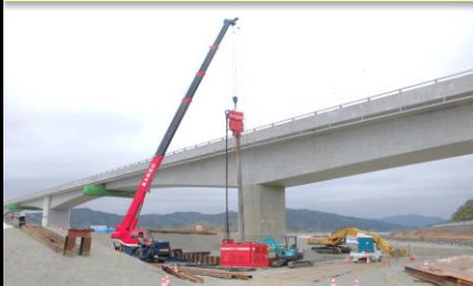
高知県 仁淀川河口大橋工事