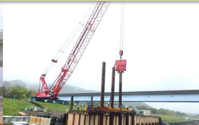
高知県 県道高知南環状線工事