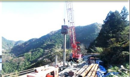
高知県 高瀬D4ブロック抑止杭建設工事