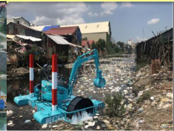
フィリピン 案件化調査