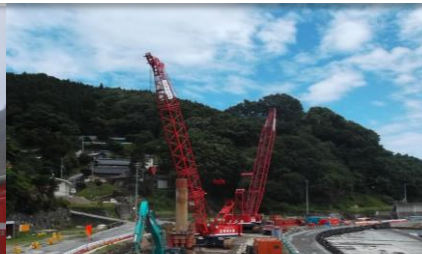
岩手県 崎浜漁港海岸災害復旧工事