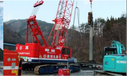
岩手県 腹帯地区道路工事