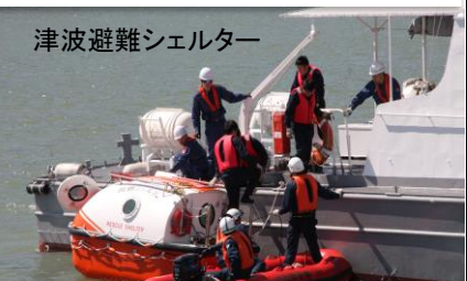
津波避難シェルター