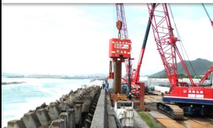
高知県 南国海岸堤防災害復旧工事