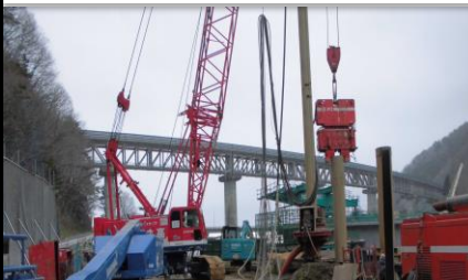
岩手県 下安家道路工事