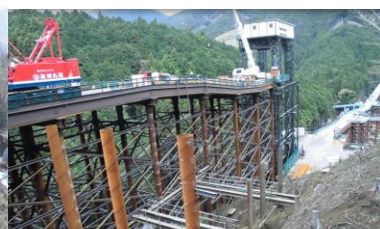
山梨県 中部横断富士川第一橋工事