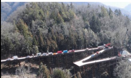
山梨県 中部横断江尻窪工事