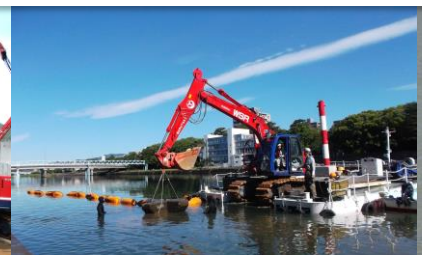
高知県 鏡川ブロック撤去